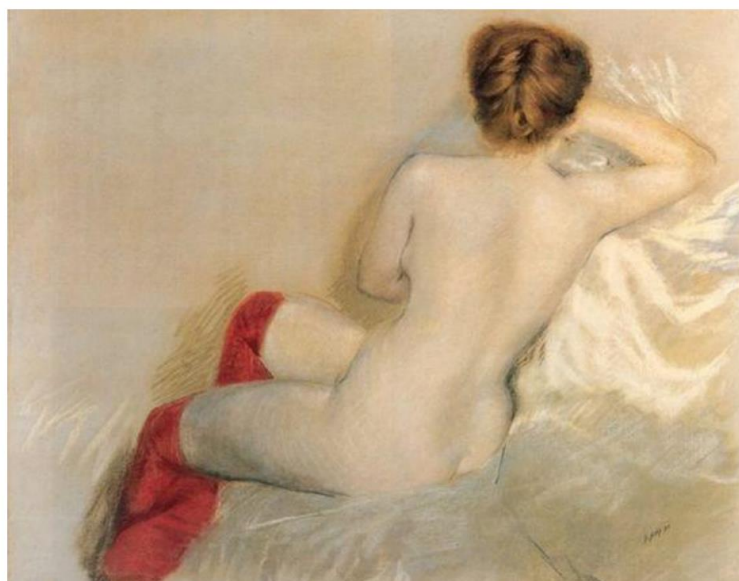
Giuseppe de Nittis – Nudo con le Calze Rosse - 1879

Leitmotiv diesmal: „Götter in Frankreich ...“